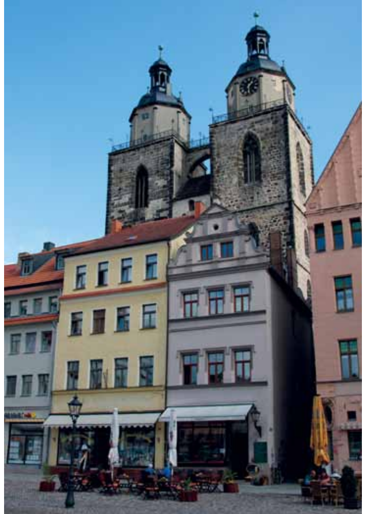
Bykirken i Wittenberg, hvor Luther prædikede regelmæssigt gennem 35 år.

Endelig kan man læse mere på: www.kirkehojskolen.com