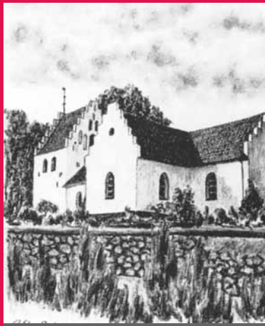
VESTER AABY KIRKE