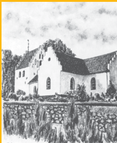
VESTER AABY KIRKE