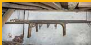
At sige farvel