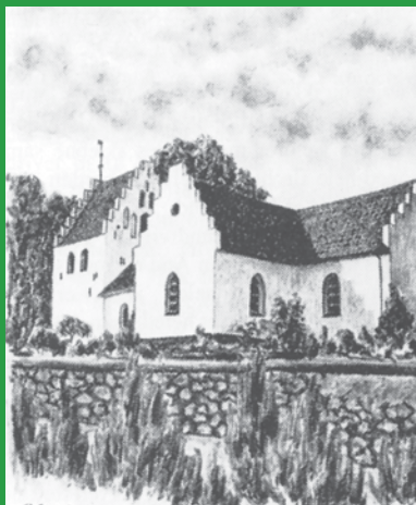
VESTER AABY KIRKE