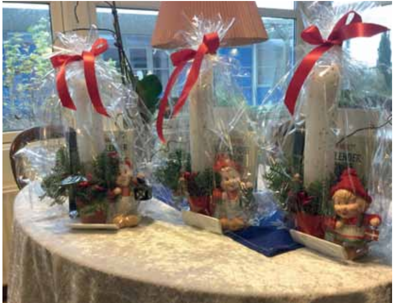
Vennernes seneste julehilsen til beboerne

Set fra et præsteperspektiv er en af "Lysbjergparkens Venners" største fortjenester, deres fantastiske bestræbelser på, at bringe det kirkeliv ind på plejehjemmet, som beboerne måske ikke længere har så rig mulighed for at følge. Sagt med andre ord, at gøre kirkelivet nærværende for vore ældre medborgere. En gang om måneden holdes der således gudstjeneste på plejehjemmet for beboerne og for de udefrakommende gæster. Som præst er det en stor glæde at holde gudstjenesten