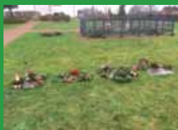
Gravsteder - for de levende!