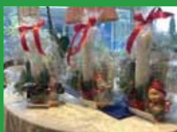
Nøgleordet er nærvær